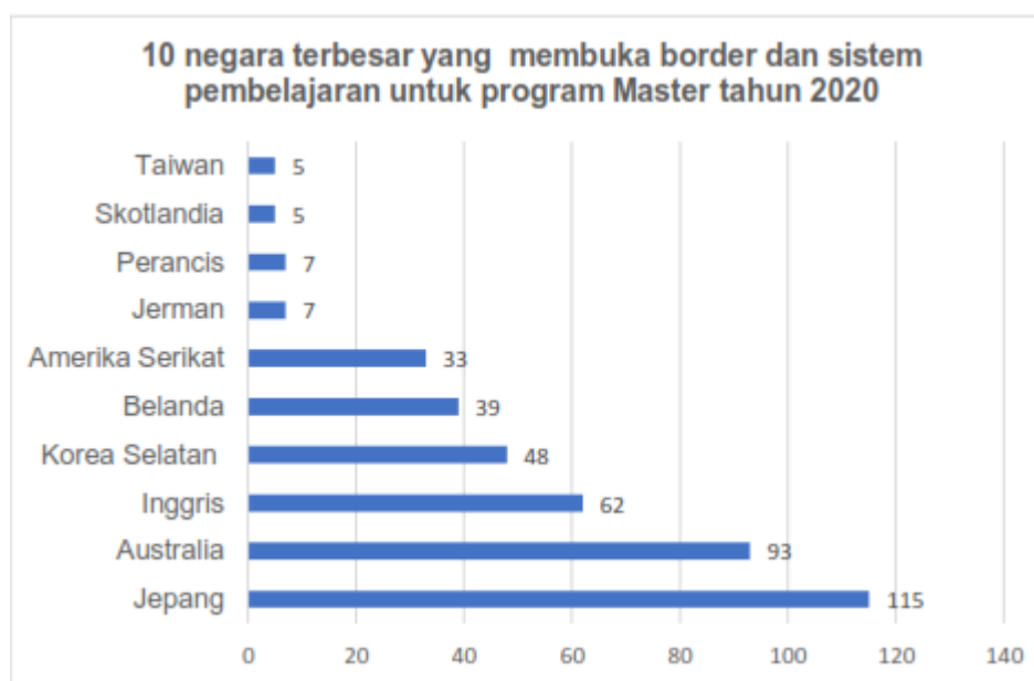
Gambar 1.3. Data jumlah penerima tugas belajar di 10 negara terbesar yang membuka sistem pembelajaran untuk program Master tahun 2020

Grafik pada Gambar 1.2. diatas adalah menjelaskan jumlah penerima tugas belajar di 10 (sepuluh) negara dengan negara penerima terbesar sampai urutan terkecil untuk program studi Doktoral (S3) pada saat pandemi Covid-19 yaitu pada tahun 2020. Pada saat pandemi sistem pembelajaran dibuka melalui teknik pembelajaran daring/online/offline maupun hybrid. Urutan negara yang paling banyak diminati oleh para penerima tugas belajar program studi Doktoral adalah Australia, Jepang, Inggris, Belanda, Amerika Serikat, Taiwan, Malaysia, Jerman, Korea Selatan dan yang terakhir adalah Perancis.