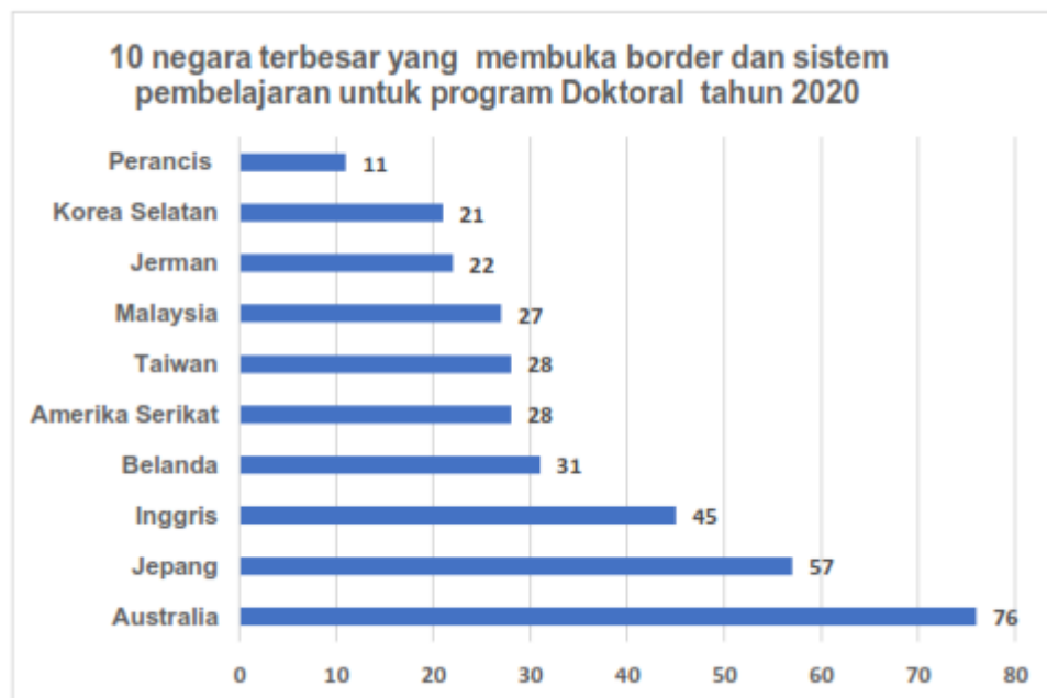
Gambar 1.2. Data jumlah penerima tugas belajar di 10 negara terbesar yang membuka sistem pembelajaran untuk program Doktoral tahun 2020

Namun demikian masih ada beberapa negara pada pertengahan tahun 2020 hingga yang masih belum terdampak pandemi dan membuka akses bagi orang asing untuk melanjutkan studinya ke luar negeri. Walaupun jadwal pelaksanaan mulai pembelajaran sempat tertunda yang seharusnya sudah dimulai awal tahun 2020 namun karena pandemi sehingga ditunda sampai dengan mendekati akhir tahun 2020. Negara-negara yang masih membuka aksesnya untuk penerima studi baik program doktoral maupun master.